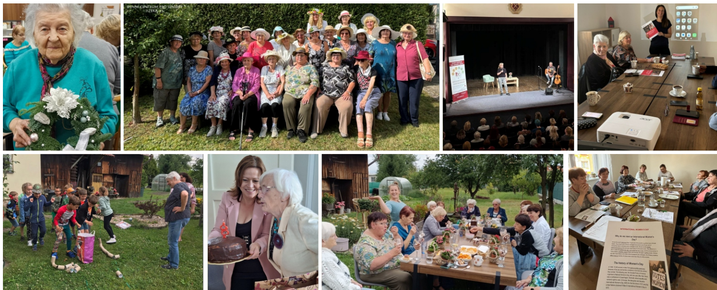
Denní centrum pro seniory JIZERA: 15 let péče, podpory a společných příběhů.

NA VLNĚ JIZERY Magazín Denního centra pro seniory JIZERA DUBEN 2025