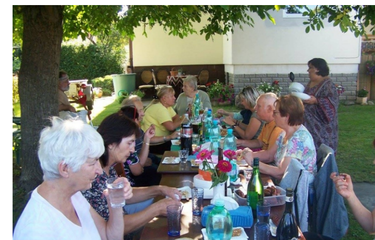
ZAHRADNÍ GRILOVÁNÍ V DCJ

Přijetí do zařízení předchází osobní setkání, kdy se zjistí rozsah potřeb zájemce a čemu by se rád u nás věnoval. Na základě toho se dohodnou