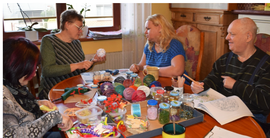
VELIKONOČNÍ TVOŘENÍ