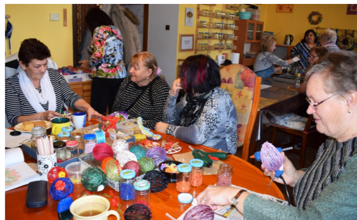
ŘEMESLNÉ KURZY