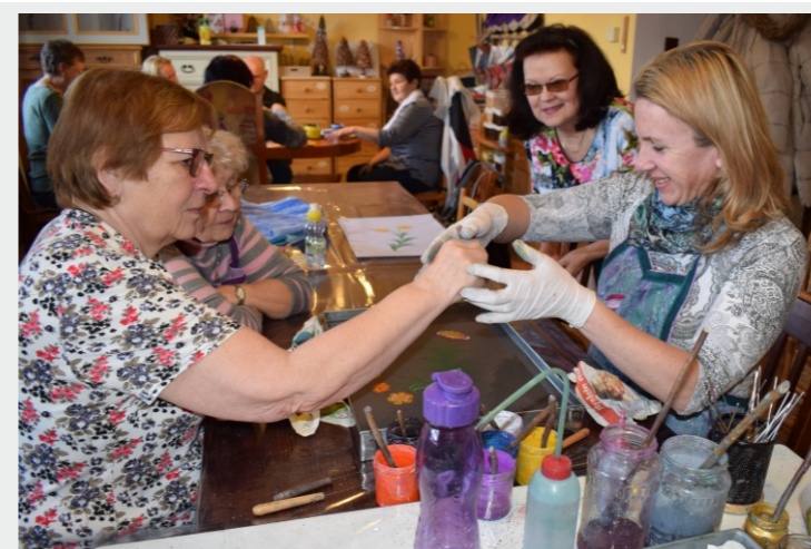
TECHNIKA MALBY EBRU

Zakoupením výrobku zhotoveného klientem centra podpoříte nejen naši činnost, ale také darujete úsměv, že naše tvoření potěšilo i někoho dalšího.