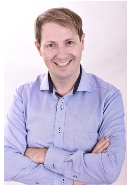
Mgr. Ondřej Lochman, Ph.D. starosta města Mnichovo Hradiště